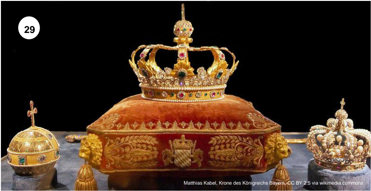
Matthias Kabel, Krone des Königreichs Bayern, CC BY 2.5 via wikimedia commons